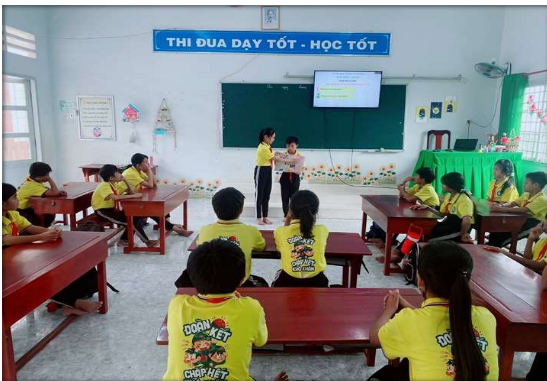
Hoạt động đọc sách, báo