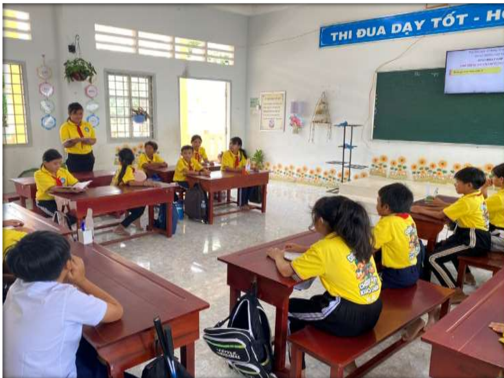
Thành viên ý kiến