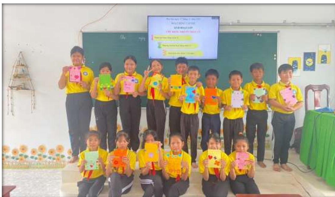
Chủ đề “Làm Thiệp” nhân ngày 8/3