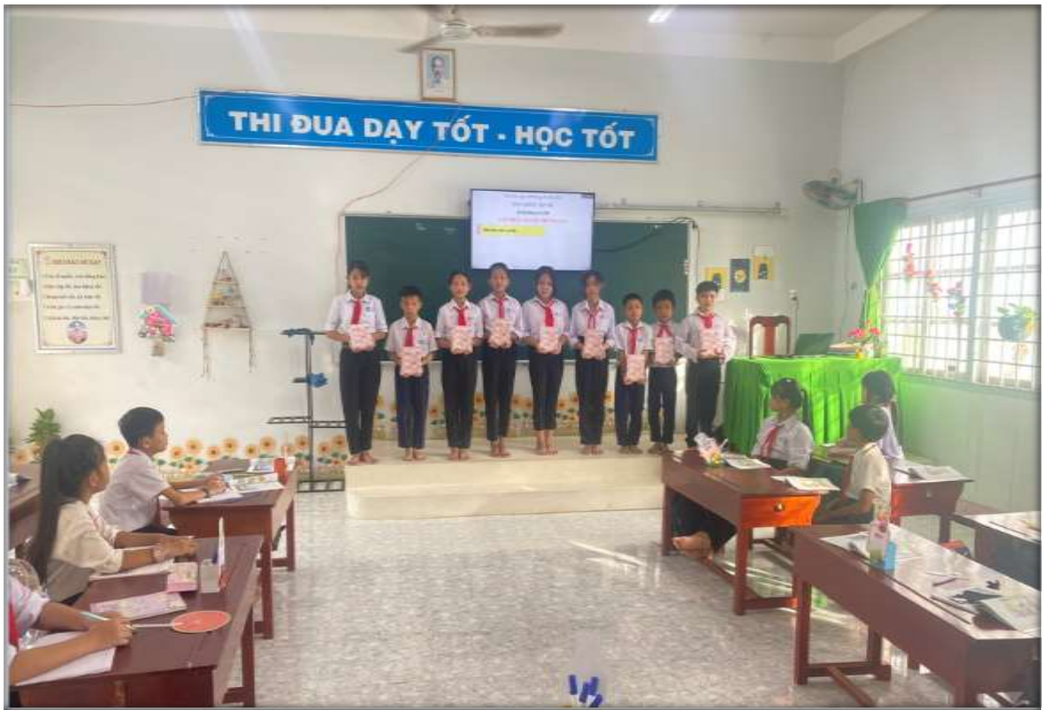
Hình 1: Ban cán sự lớp ra mắt và nhận nhiệm vụ