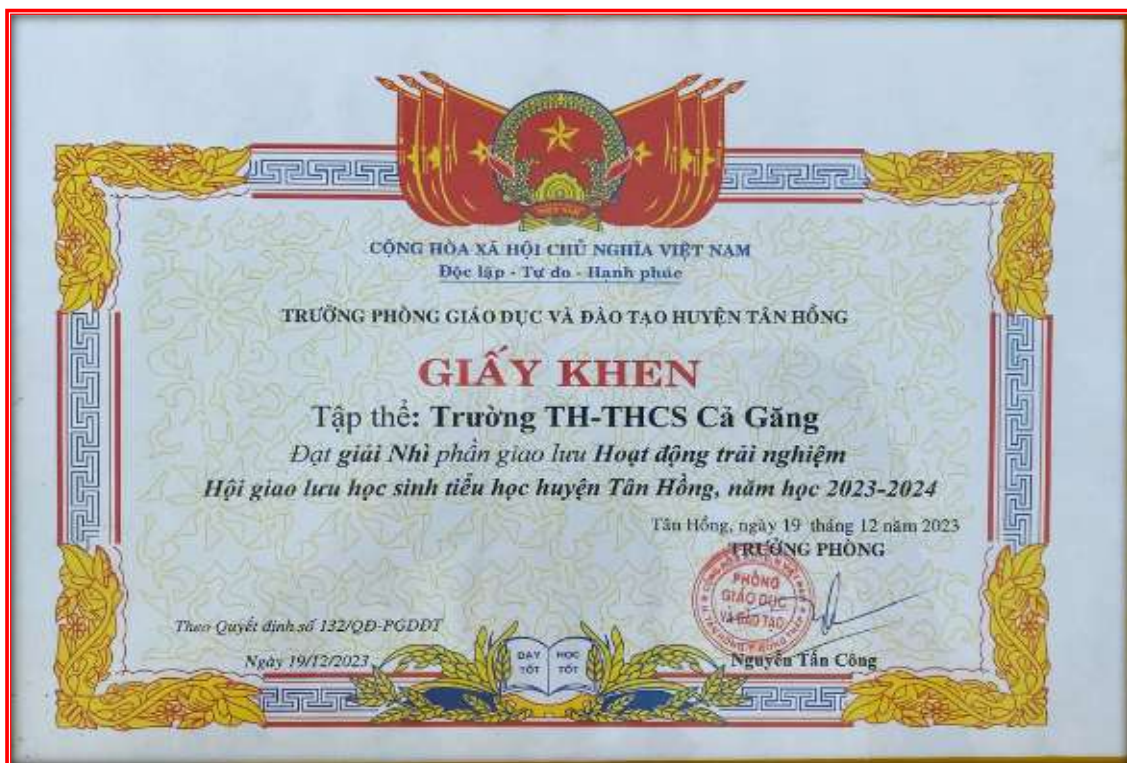
Hình 7: Thành tích ngày hội giao lưu phân thi “Hoạt động trải nghiệm” năm học 2022 -2023; năm học 2023 -2024