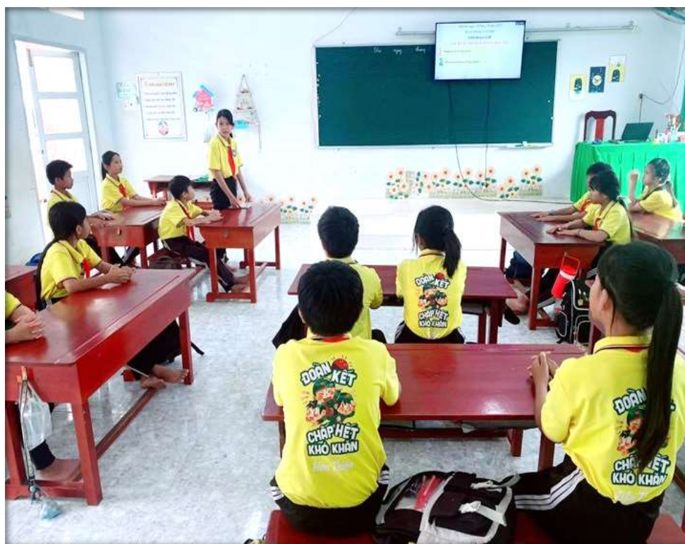
Tổ trưởng nhận xét