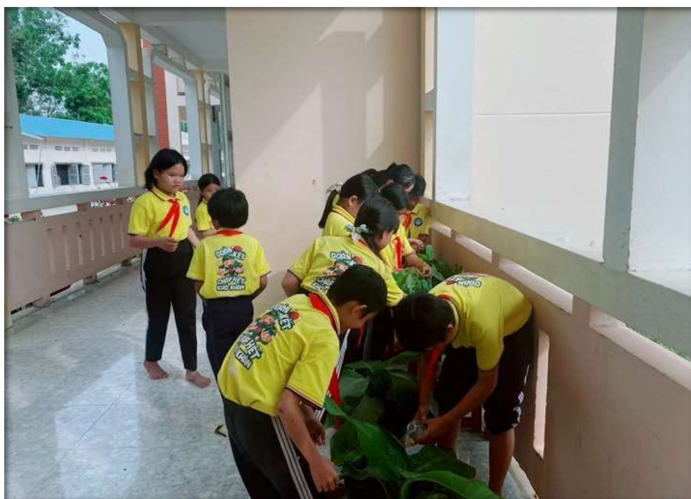
Hoạt động chăm sóc cây xanh