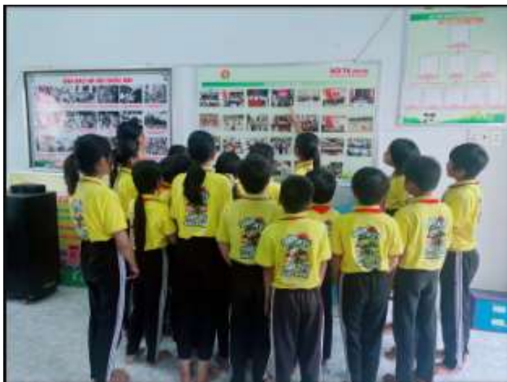
Hoạt động tham quan phòng truyền thống Đội