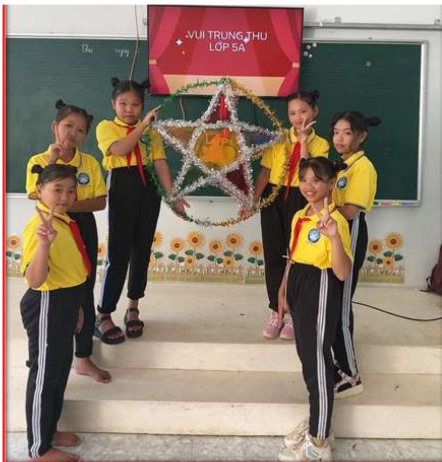
Chủ đề “Vui Trung thu “ Làm lồng đèn Trung thu