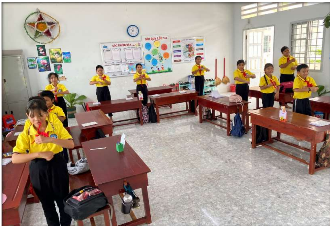
Hình 4: Hoạt động Khởi động