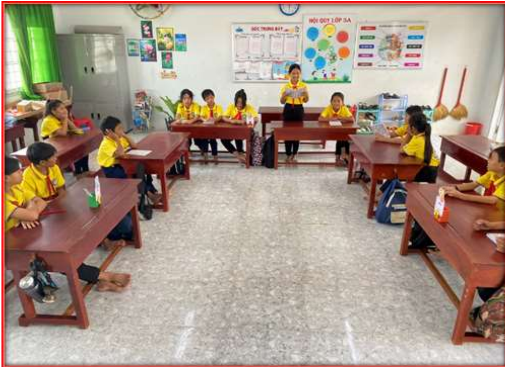
Lớp trưởng nhận xét