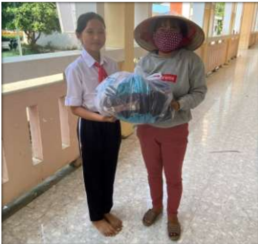
Hoạt động trao tặng quần áo cũ