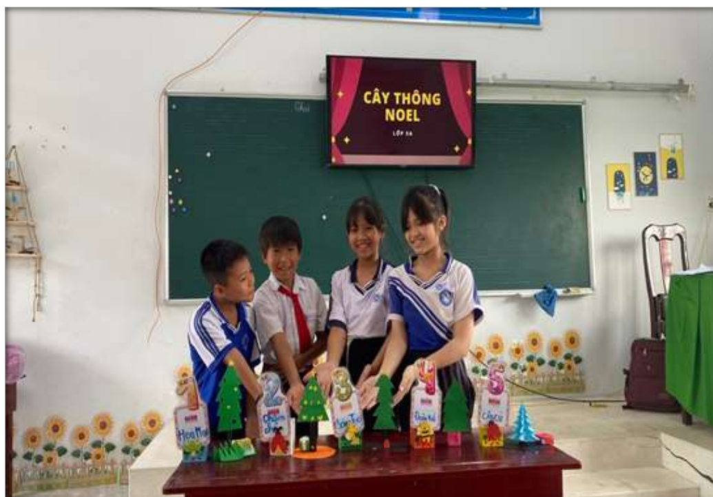
Chủ đề: Cây thông Noel