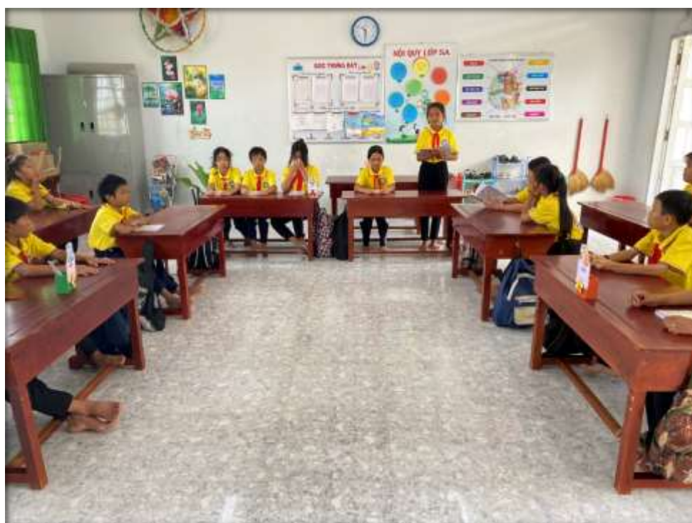
Lớp phó học tập nhận xét