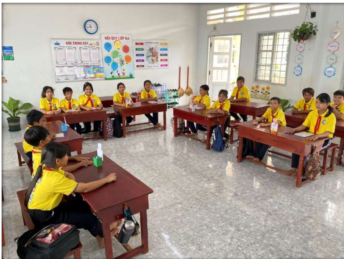
Hình 3: Sắp xếp lớp hình chữ U