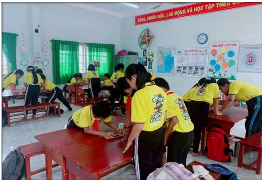
Chủ đề “Nhà sáng chế tài ba” chế tạo đồ dùng điện vận dụng bài Khoa học “Lắp mạch điện đơn giản”