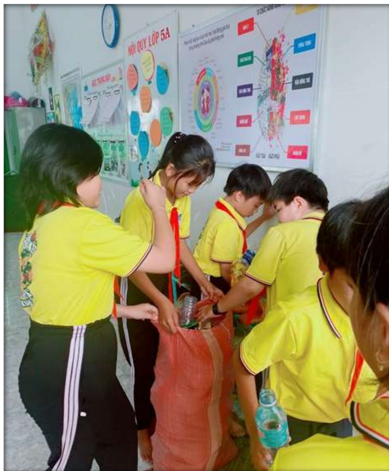
Hoạt động thu gom chai nhựa đã qua sử dụng