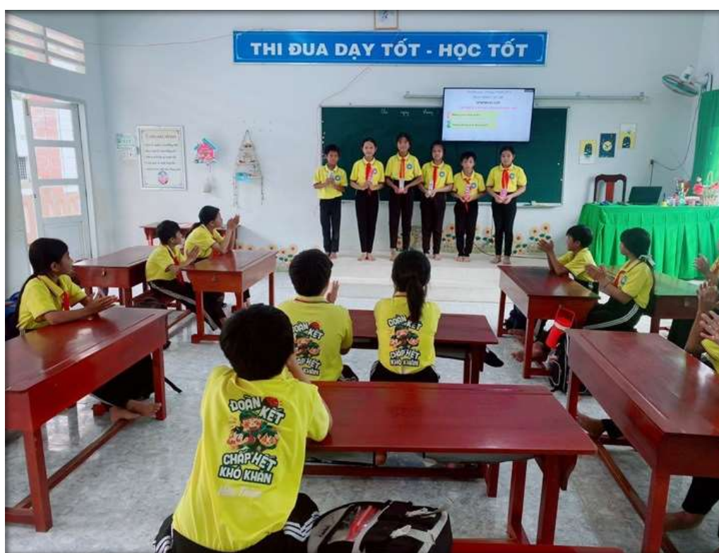
Tuyên dương cá nhân xuất sắc trong tuần