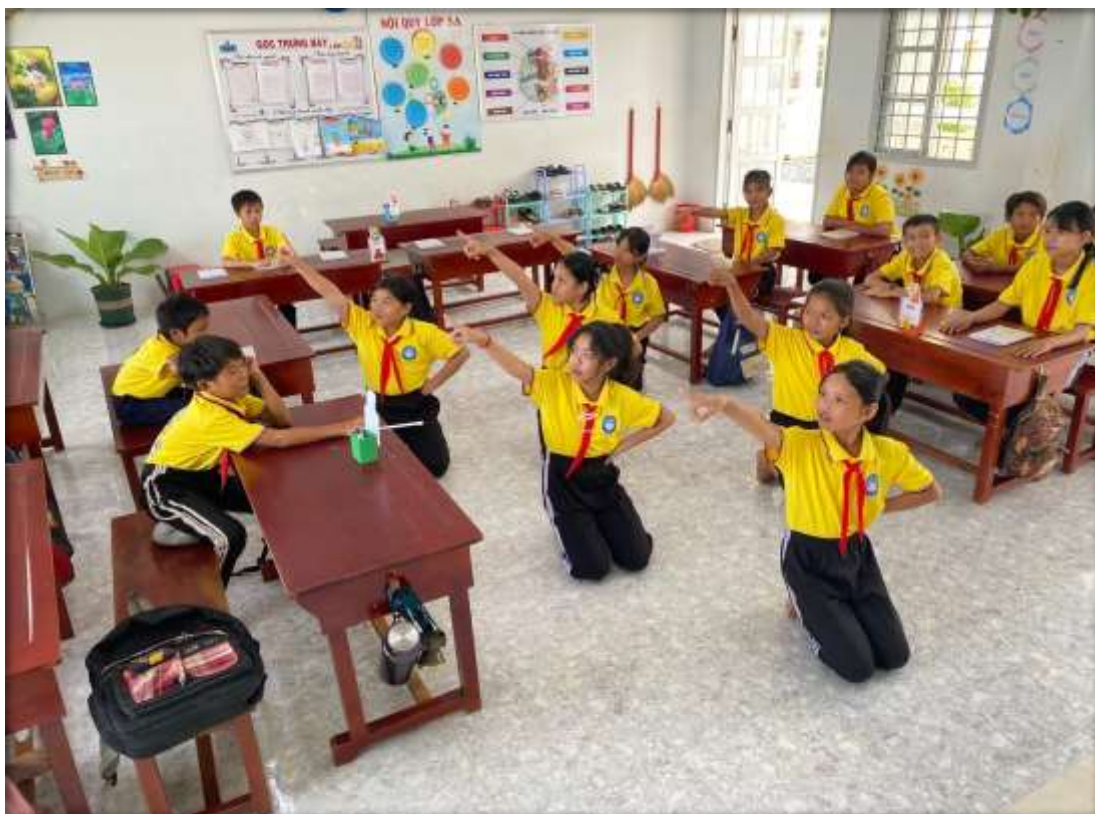
Hoạt động văn nghệ