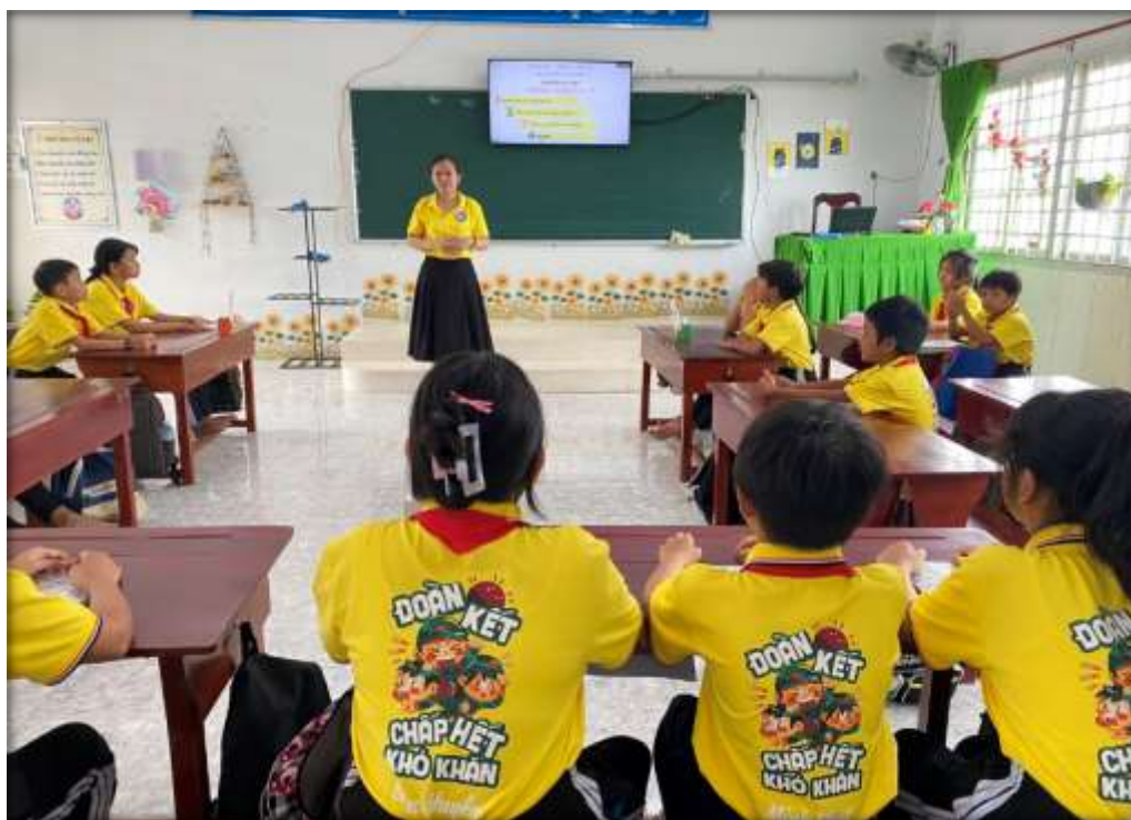
Giáo viên lớp nhận xét